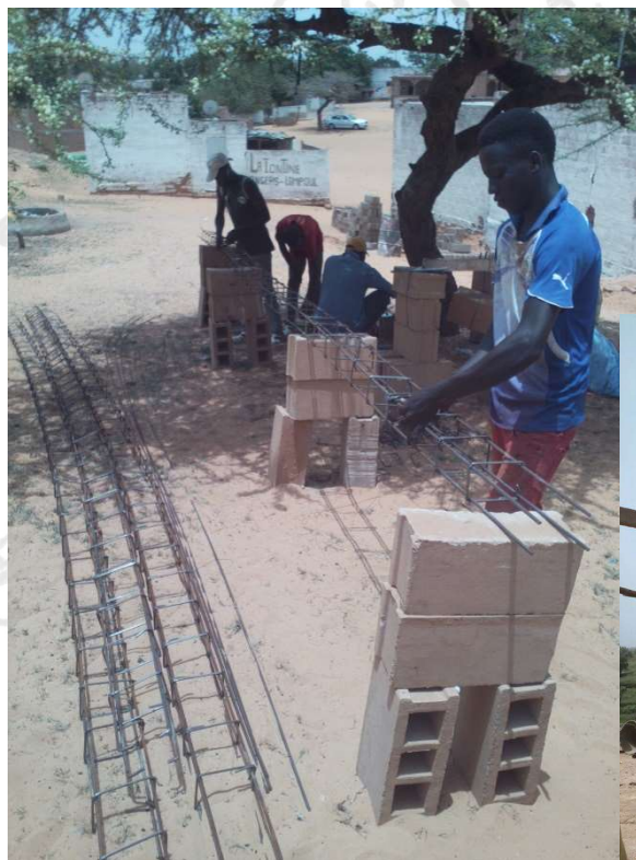
Les maçons au travail