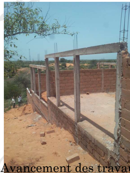
Avancement des travaux